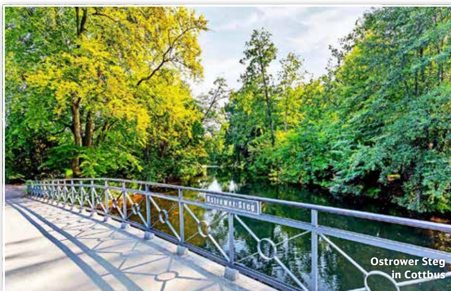
Ostrower Steg in Cottbus